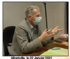
Albertville, le 22 Janvier 2021

ENTREVUE AVEC H. GAYMARD : Actuellement, Président du Conseil Départemental de la Savoie, il a été Ministre de l'Agriculture (2002) puis Ministre de l'Industrie des Finances (2004). Il est l'acteur politique incontournable en Savoie.