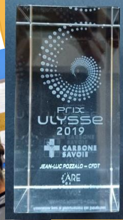
Colloque Cfdt en Roumanie sur la filière Aluminium