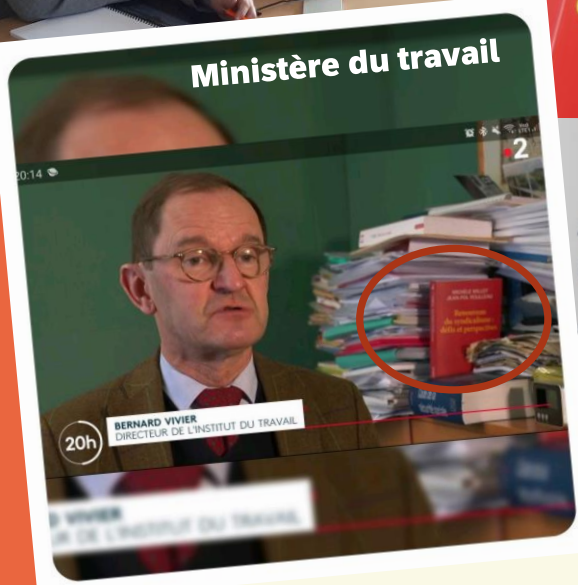
Ministère du travail