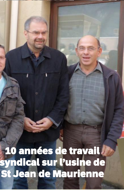
10 années de travail syndical sur l'usine de St Jean de Maurienne