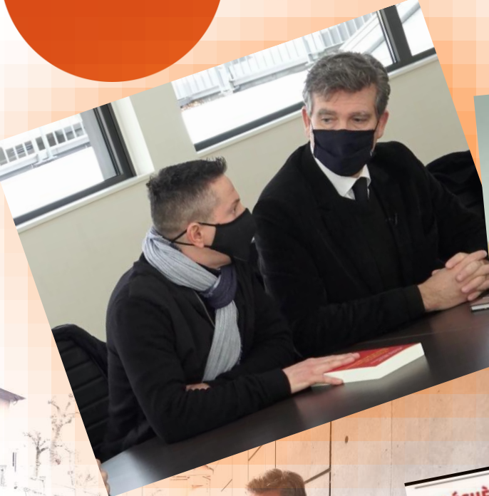
Ministère de l'économie « Bercy »